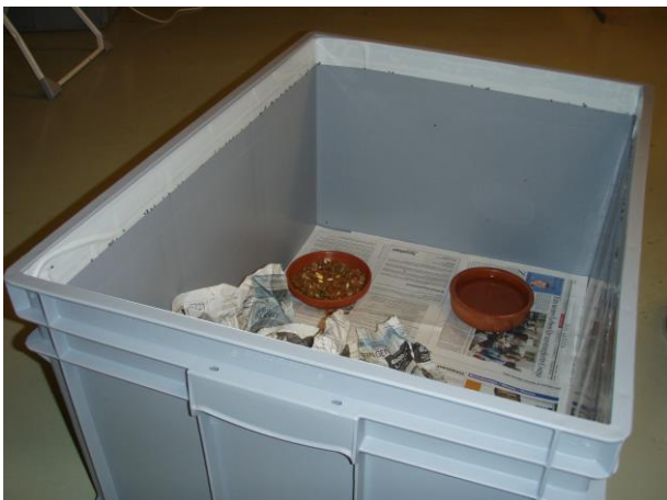
Kiste mit doppelseitigem Klebband

Müssen Sie einen verzeckten Igel einige Zeit bei sich zuhause unterbringen, empfiehlt sich folgende Aufbewahrung: bei einer Plastikbox mit genügend hohem Rand (mind. 40cm, damit der Igel nicht herausklettert) wird oben rundherum ein doppelseitiges Klebeband angebracht. Zecken, die vom Igel abfallen und die Wand hochkrabbeln, bleiben daran kleben und können später mit dem Band entfernt werden. In die Kiste wird eine Schachtel oder besser, eine gut zu reinigende Plastikbox als Schlafhaus gestellt, diese muss oben offen sein, damit sie der Igel nicht als Ausstiegshilfe benutzt. Alternativ zur grossen Plastikbox können auch eine grosse (oder mehrere zusammengefügte) Kartonschachtel mit dem Klebeband versehen werden. Allerdings sind bei Kartonschachteln meist Ritzen vorhanden, in denen sich die Zecken verkriechen können.