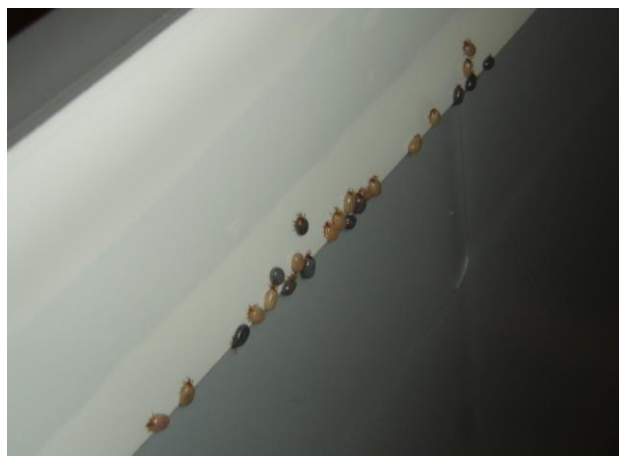
Zecken bleiben am Klebband kleben