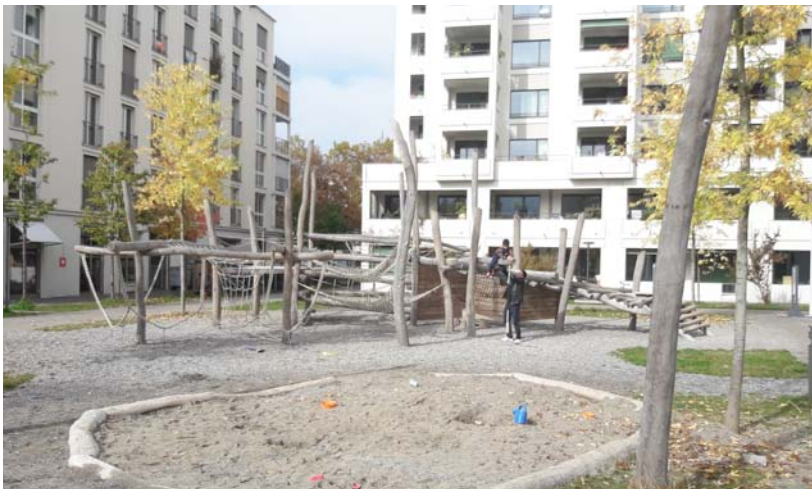
1. Spielplatz klein (mit Klettergerüst)