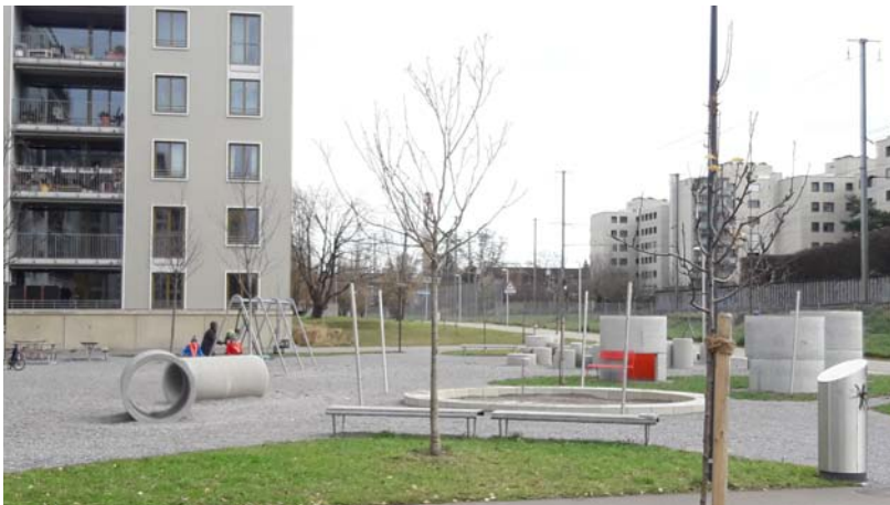
3. Spielplatz gross