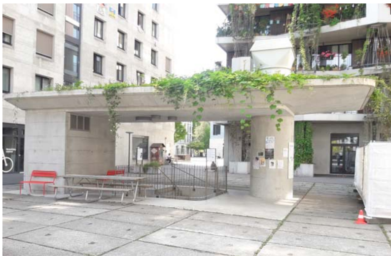
4. gedeckter Unterstand