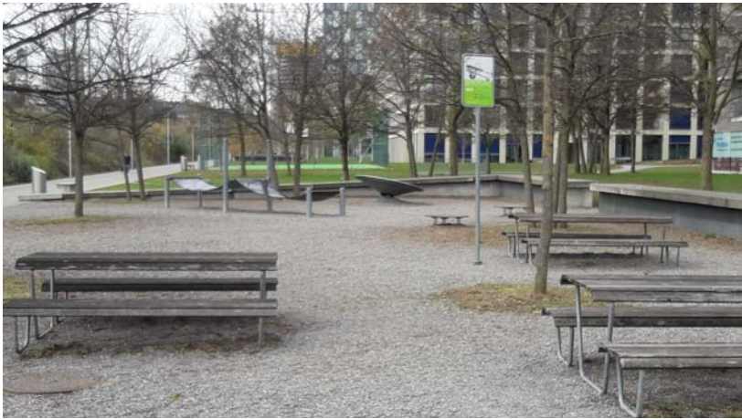
2. Spielplatz gross