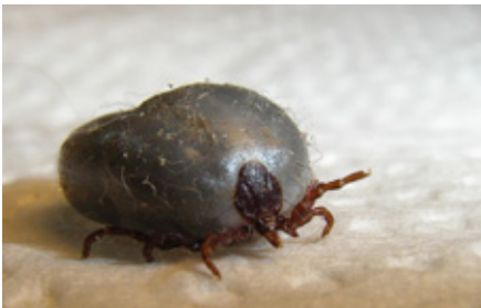
Eine vollgesogene weibliche Zecke (bis 1,5 cm gross) im Adultstadium ist einfach zu finden. Zeckenlarven und -nymphen sind hingegen nur 0,5 bis 2 mm gross.

Die Gefahr eines Zeckenstichs beim Spaziergang durchs hohe Gras, im Wald oder bei der Gartenarbeit wird also dieses Jahr etwas höher sein als sonst. Einen gewissen Schutz bieten langärmelige Kleidung und lange Hosen. Am wichtigsten aber ist, dass man nach einem Aufenthalt in Zeckenhabitaten (Orte, wo typischerweise mit Zecken zu rechnen ist) den Körper noch am gleichen Tag gründlich nach möglichen Blutsaugern absucht.