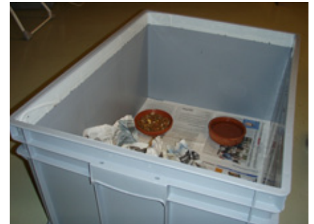
Plastikkiste (40 cm hoch) mit doppelseitigem Klebeband, wie wir sie im Igelzentrum verwenden

oberen Rand der Kiste rundherum ein doppelseitiger Klebeband angebracht. Zecken, die vom Igel abfallen und die Wand hochkrabbeln, bleiben daran kleben und können später mit dem Band entfernt werden.